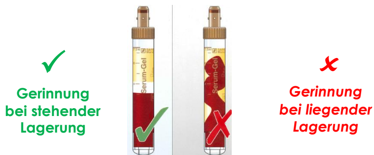
Abbildung 2: mit freundlicher Unterstützung der Fa. Sarstedt AG & Co.KG

Serumröhrchen abnehmen, mindestens 20 – 30 Minuten aufrechtstehend durchgerinnen lassen, danach zentrifugieren: ca. 10 min bei 2.500 g.